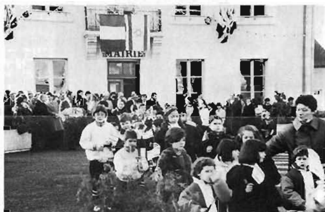
Sous le drapeau français et celui de l'Etat d'Israël, les enfants des écoles qui ont chacun à la main un de ces drapeaux s'apprennent au défilé.