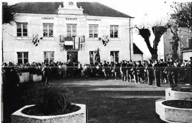
La fanfare prend place. Elle avait appris pour la circonstance l'Hymne Israélien : Bravo !

Celle-ci débuta par un dépôt de gerbe au Monument aux Morts où furent interprétés