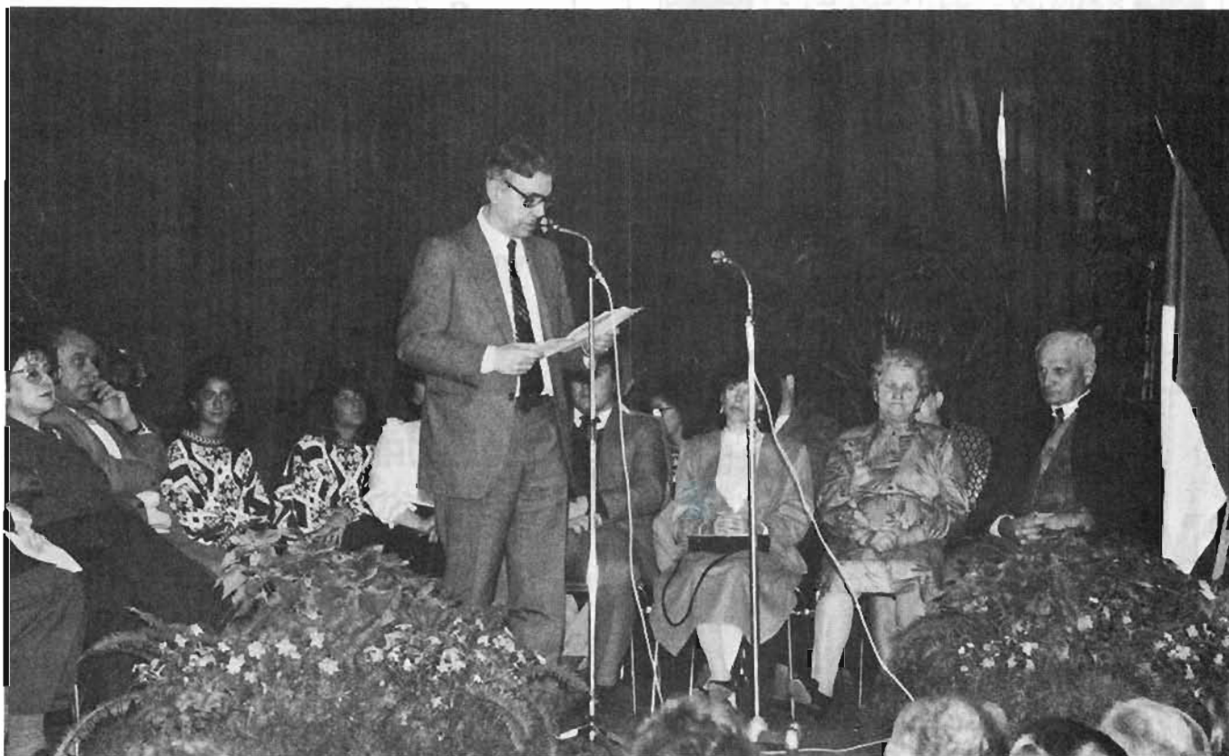
M. AVIRAN, Ministre Plénipotentiaire près l'Ambassade d'Israël prononce son allocution devant une salle comble.