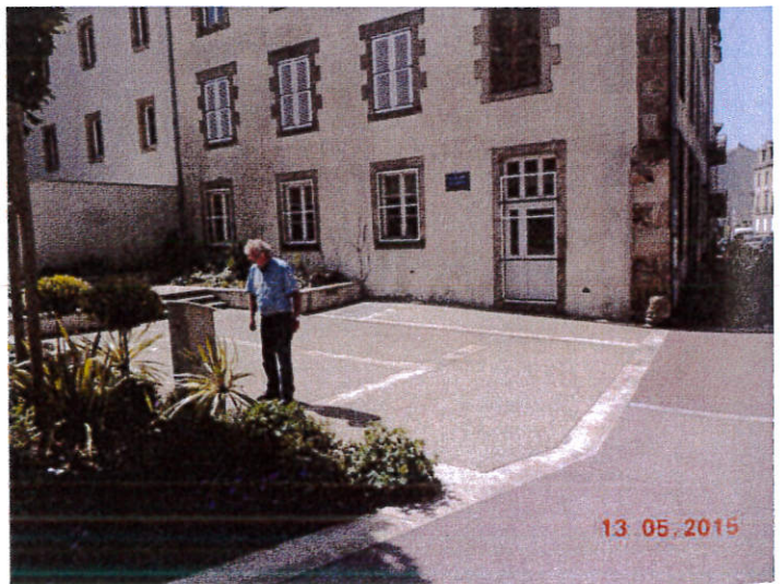
LA PLACE DES JUSTES