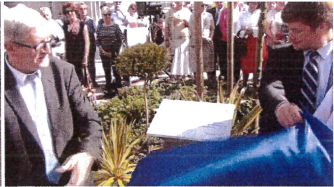
LE DEVOILEMENT DE LA PLAQUE ET DE LA STELE