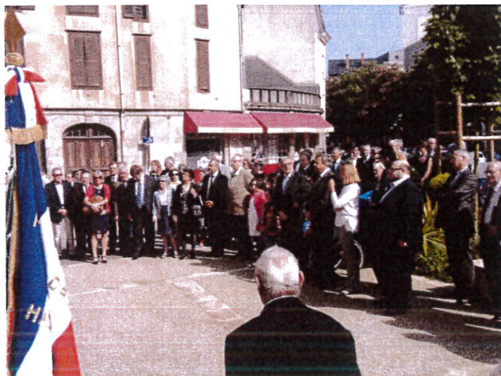
VUE DU PUBLIC