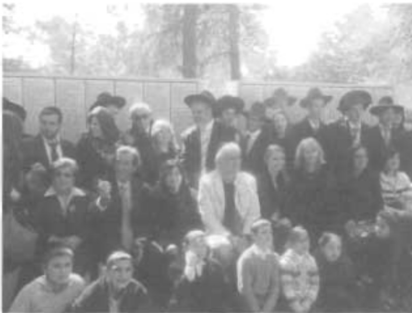
Photo de famille, les enfants d'Israël ne gagneront jamais