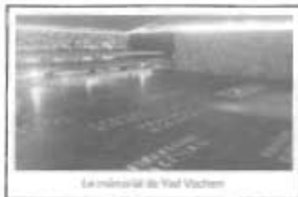
Le mémorial de Yad Vashem