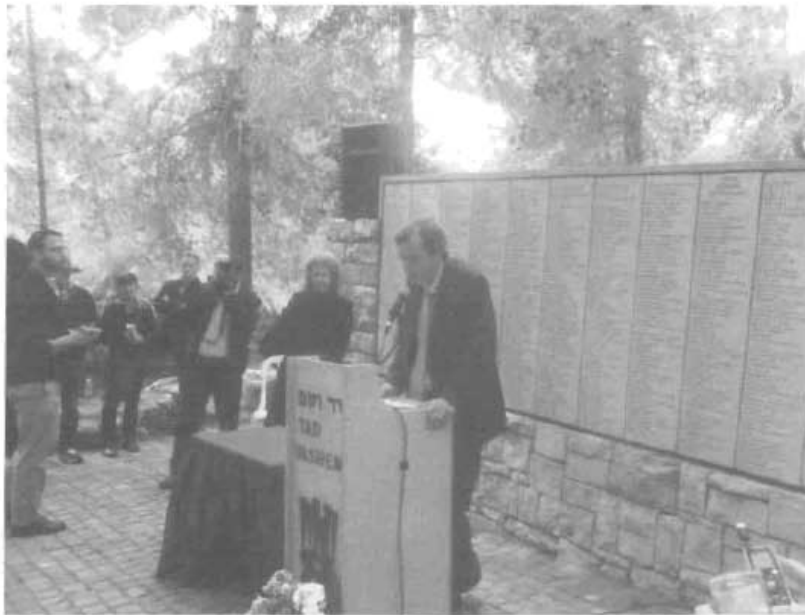
L'ambassadeur de France en Israël, ne cache pas la responsabilité de la France et sa complicité pendant la guerre Nac.