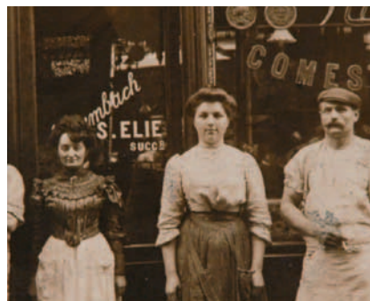
Les Justes de Paris ou la diversité des solidarités parisiennes

Après une introduction de Madame Anne Hidalgo, maire de Paris, l'exposition s'organise en trois parties :