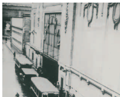
Les réseaux de sauvetage et les Justes de Paris