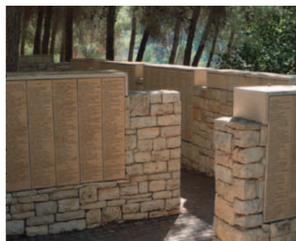
Paris, une ville des Justes de France

En redécouvrant la ville à travers ces histoires, c'est toutefois les identités des quartiers de Paris qui apparaissent. Si en 1939, Paris compte des familles juives françaises depuis plusieurs générations, la majorité est immigrée, originaire de l'Est de l'Europe ou du pourtour méditerranéen. Ces juifs ont quitté leurs pays de naissance pour fuir les persécutions antisémites ou améliorer leurs conditions de vie. Ces origines et conditions se retrouvent dans l'espace de la ville.