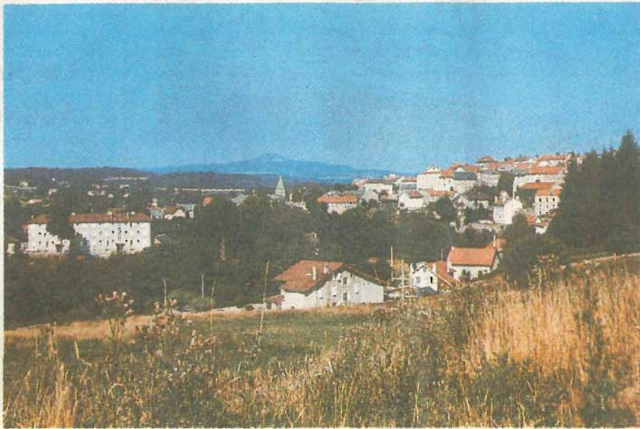
«Il faut déchamboniser le Chambon»

L'espace d'un week-end, sous les auspices de la commune de Chambon-sur-Lignon, de la Société d'Histoire de la montagne et des Eglises réformées du Plateau, 300 personnes, paysans du Plateau, Français de tous les coins de France, mais également individus en provenance des Etats-Unis, d'Allemagne ou de Suisse, ont refait l'Histoire le temps d'un colloque. Son thème: «Accueil et résistance» couvrait la période 1939 à 1944.