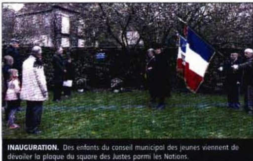
INAUGURATION. Des enfants du conseil municipal des jeunes viennent de dévoiler la plaque du square des Justes parmi les Nations.

« En France, 76.000 Juifs dont 11.400 enfants, furent déportés. Seuls 2.550 revinrent, aucun enfant ne se trouvait parmi eux.