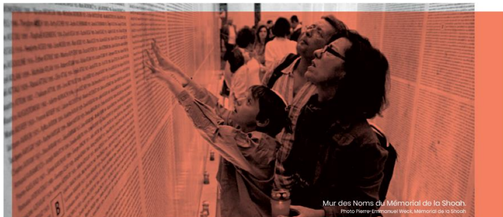
Mur des Noms du Mémorial de la Shoah.