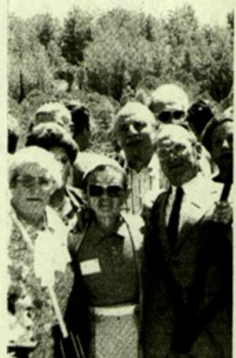
Les anciens élèves et déportés de l'école se rendent vers la Crypte de la Déportation à Jérusalem.

de ips pel ant ative t de ; et ; de des Pri- u 4° que que jeté nt la que trée int- e au ère de