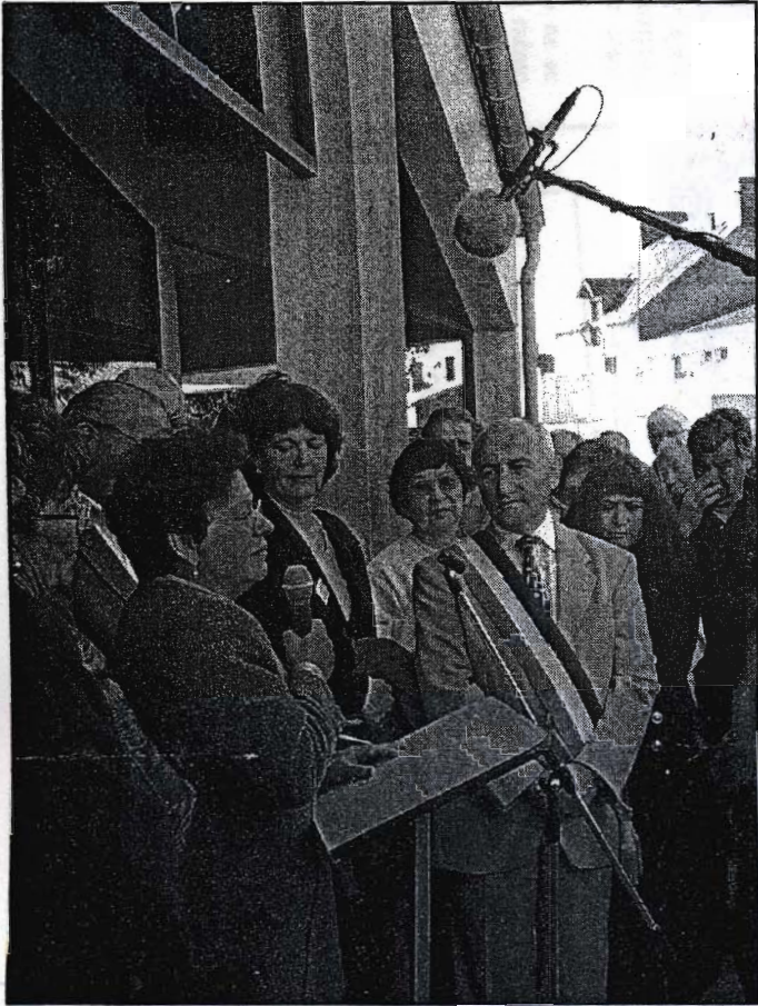
Pendant les allocutions.

Située entre Montaigu et Saint-Fulgent, la petite commune de Chavagnes-en-Paillers a, dimanche, rendu hommage à ceux de ses habitants qui ont, durant la dernière guerre mondiale, sauvé des enfants juifs d'une mort certaine.