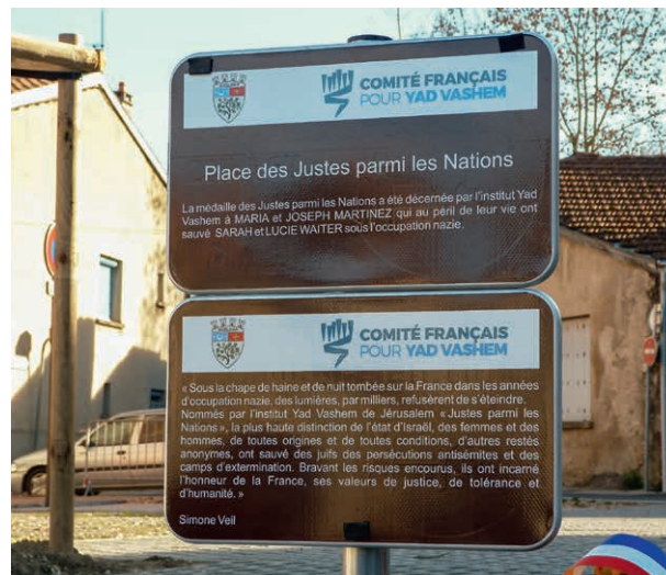
Place des Justes parmi les Nations à Lavelanet.

“ Ils sont un exemple à suivre pour les enfants des écoles qui passent chaque jour devant la plaque mémorielle édifée en leur honneur. Nous devons faire vivre cet exemple, c'est sûr! ”