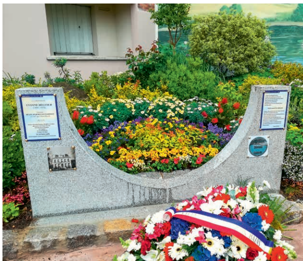
Le mémorial Yvonne Deltour, à Enghien-les-Bains.